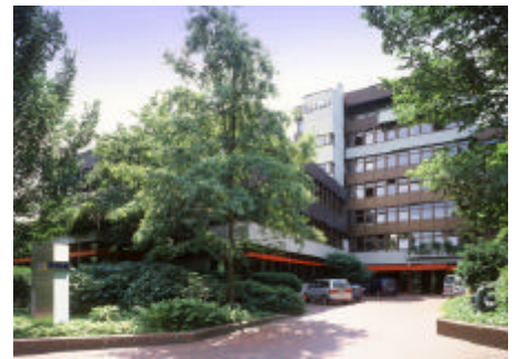
Hauptverwaltung der EWE AG

„QuickFind CRM“ findet bei der EWE nicht nur Kunden, Lieferanten oder Beträge von abgewiesenen Zahlungen, die im automatischen Verbuchungslauf aussortiert wurden. Das Programm wird auch intern erfolgreich eingesetzt. So erkennt der Sachbearbeiter in der Ergebnisliste sehr schnell Dubletten und ermöglicht ihm, in diesen Fällen Verträge zusammen zu fassen. Für die Lieferanten gilt ähnliches: Auch hier kann